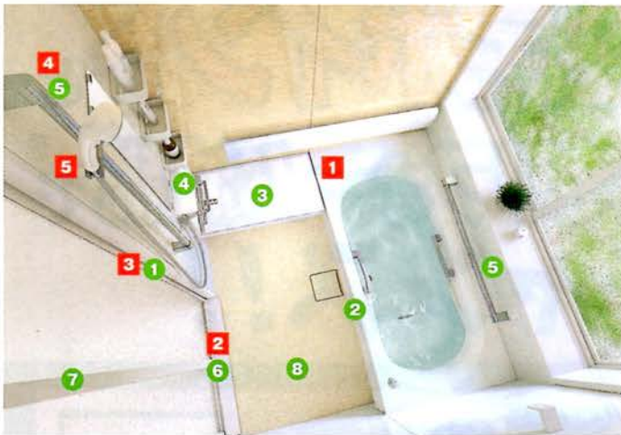
システムバスルーム サザナ 1坪サイズ Fタイプ 写真セット価格 1,666,100円(税・工事費別)