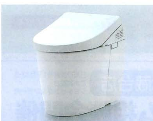
ネオレストAH 希望小売価格 334,000円(税・工事費別)