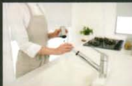
カートリッジ交換も簡単