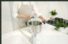
浄水器ごとホースが引き出せる