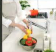
浄水でシャワーが使える